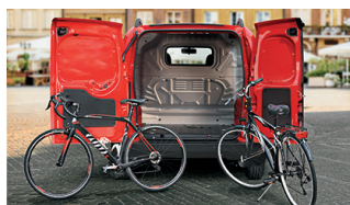
199 - Divisória em chapa com vidro