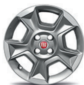
420 Jantes em liga leve 15" Trekking