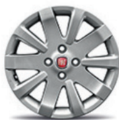
108 Jantes em liga leve 15"