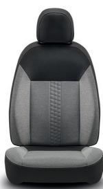
323 Tecido cinzento escuro e preto