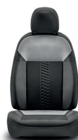
319 Tecido preto e cinzento