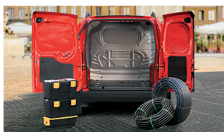
149 - Divisória em chapa

• = Série o = Opcional - = Não disponível