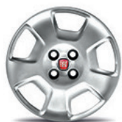
878 Tampão de roda integral