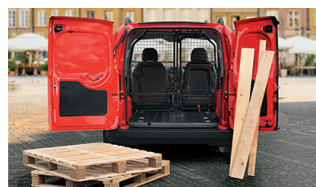
201 - Divisória em rede giratória