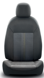
094 Tecido cinzento