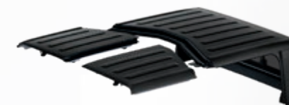
CAPOTA RÍGIDA MODULAR DE 3 PEÇAS FREEDOM TOP