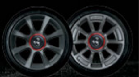
16" 8 RAIOS 16" HERITAGE