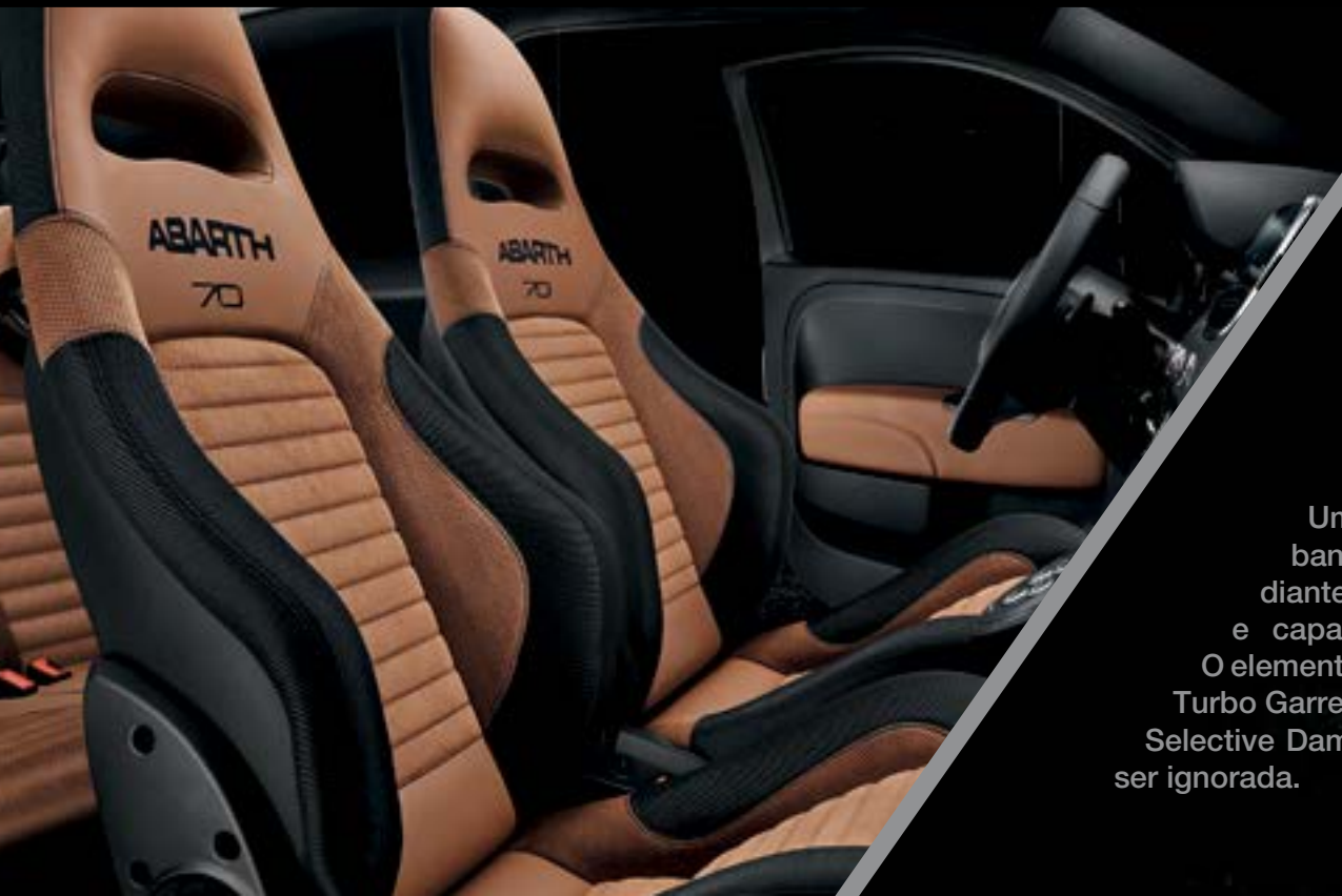
Sabelt® 70 GT em Pele Camel (opc.)

Um estilo inultrapassável que cria emoções de tirar o fôlego. Com bancos desportivos Abarth em pele, aplicações nos para-choques dianteiro e traseiro na cor da carroçaria, vidros traseiros escurecidos e capas dos retrovisores com acabamento cromado escovado. O elemento performance nunca pode ser esquecido; motor de 165 cv com Turbo Garrett e suspensões traseiras Koni com tecnologia FSD (Frequency Selective Damping). Abarth 595 Turismo, uma personalidade que não pode ser ignorada.