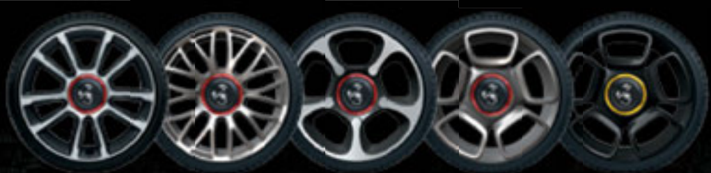
17" GRANTURISMO 17" TOURING 17" TROFEO 17" SPORT 17" PRETO OPACO DESPORTIVO