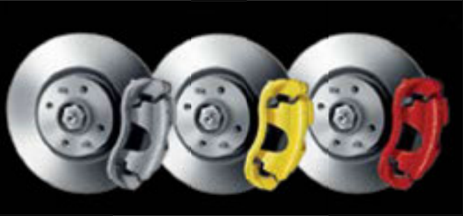
Pinças não pintadas (de série no 595) Amarelo Vermelho

Discos de travões perfurados 595 Pista e 595 Turismo