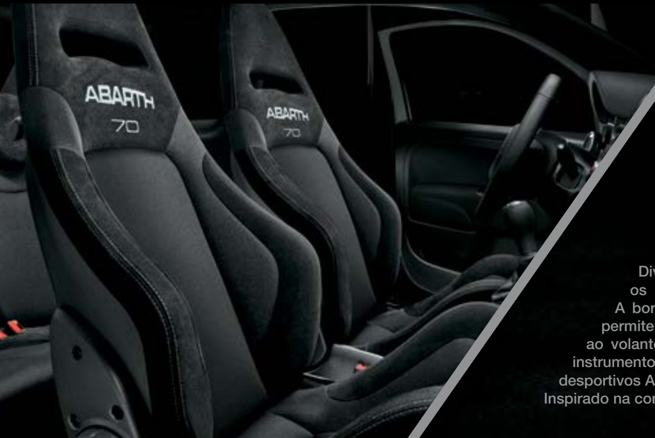
Sabelt® 70 Racing em Tecido (opc.)

Divertimento na mais pura forma. Feito para quem gosta de testar os próprios limites de performance e, depois, ultrapassá-los. A bordo, aproveita o exclusivo sistema de Telemetria Abarth que permite criar trilhos personalizados e avaliar as tuas performances ao volante. Tudo isto, e ainda pedais desportivos em aço, painel de instrumentos com visor a cores com o Modo Sport avançado e bancos desportivos Abarth em tecido com regulação em altura. Inspirado na competição, tanto no seu nome como na sua natureza.