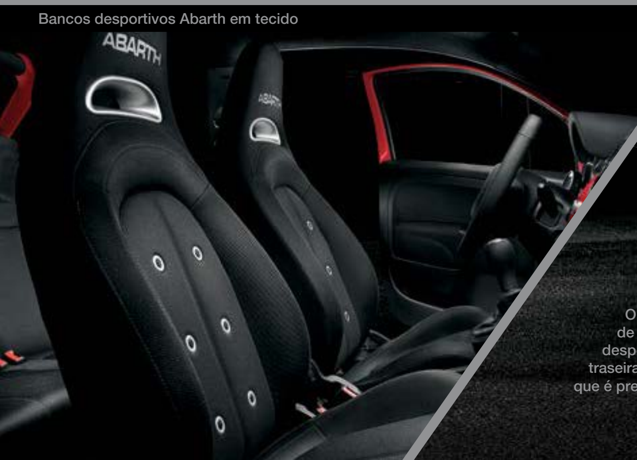
Bancos desportivos Abarth em tecido

O Abarth perfeito para o início perfeito. Motor de 145 cv T-Jet de 4 cilindros, duplo terminal de escape em aço cromado, volante desportivo revestido de pele com marcador de posição, e suspensão traseira com tecnologia FSD (Frequency Selective Damping). Tudo o que é preciso para ser picado pelo Escorpião