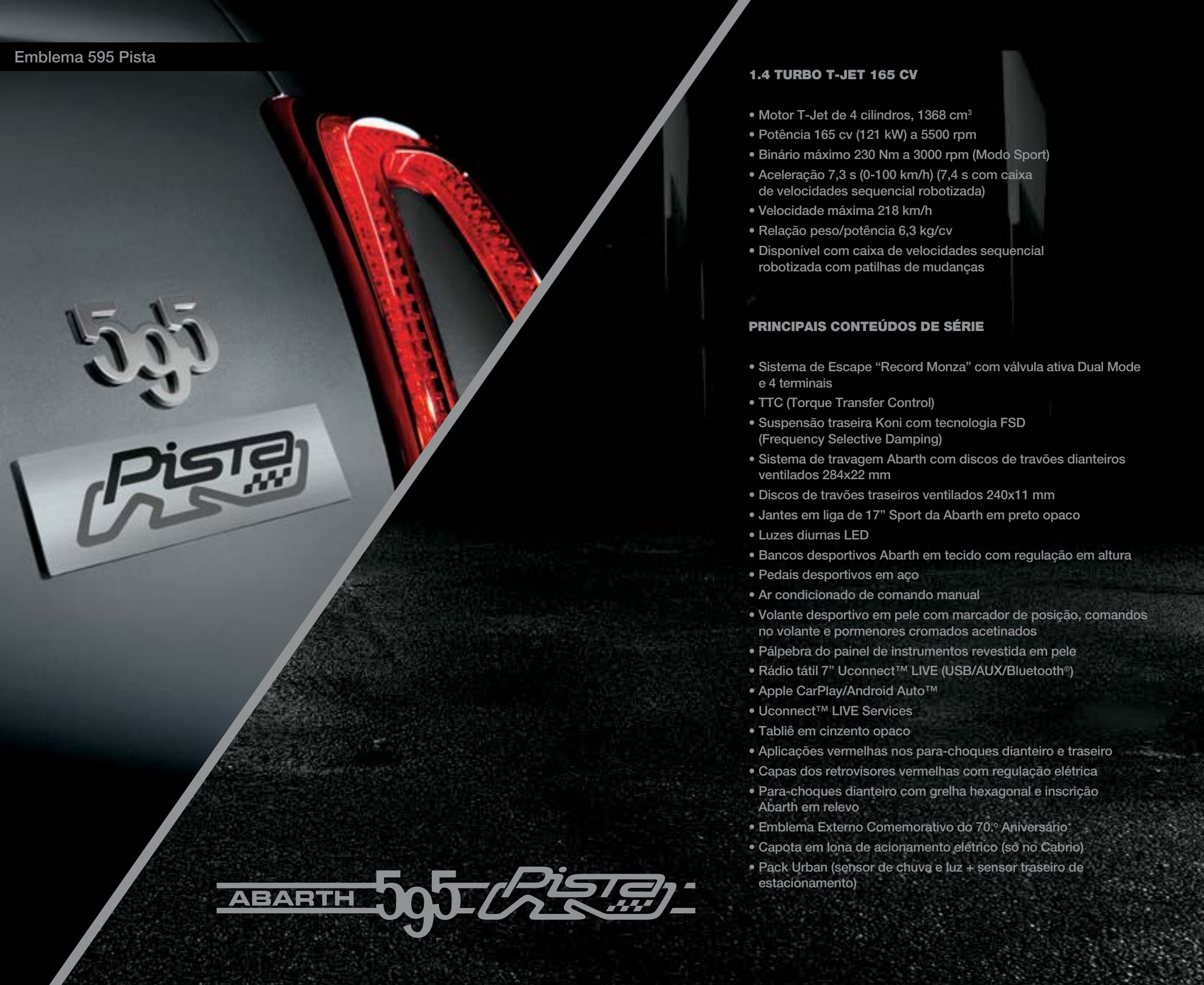
Emblema 595 Pista