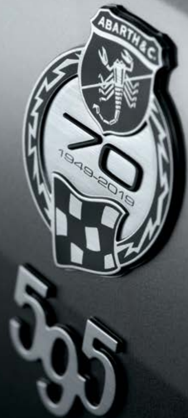
Emblema Externo Comemorativo do 70.º Aniversário