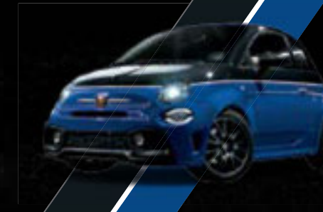
Preto Scorpione/ Azul Podio