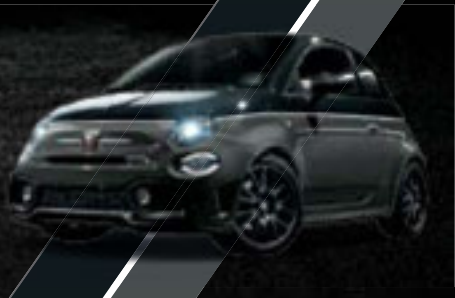
Preto Scorpione/ Cinzento Record