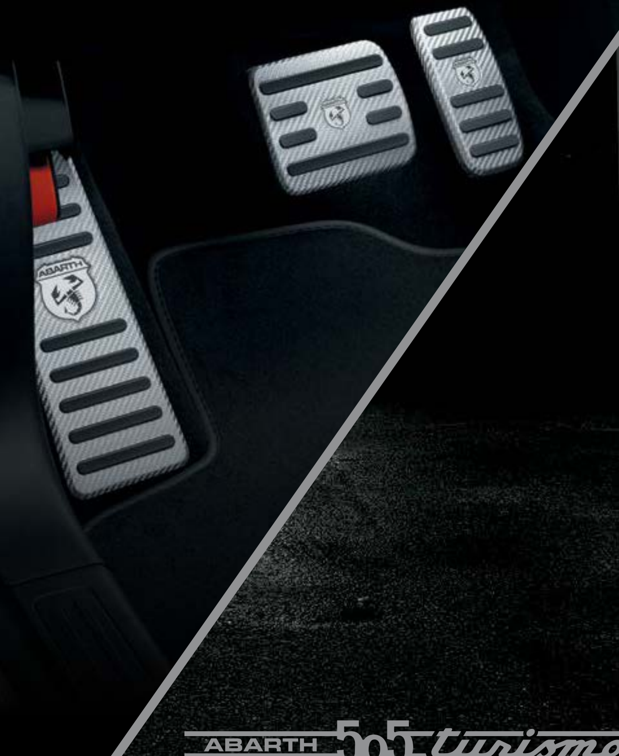
Pedais desportivos em Alutex