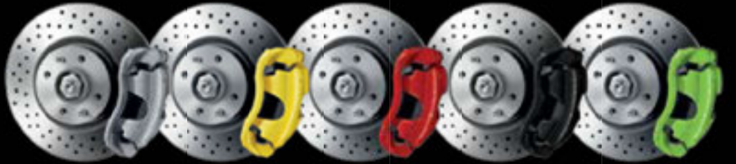
Cinzento (de série no 595 Turismo) Amarelo Vermelho (de série no 595 Pista) Preto Verde

Discos de travões perfurados 595 Pista e 595 Turismo