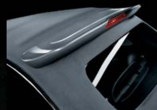
Capota em lona cinzenta