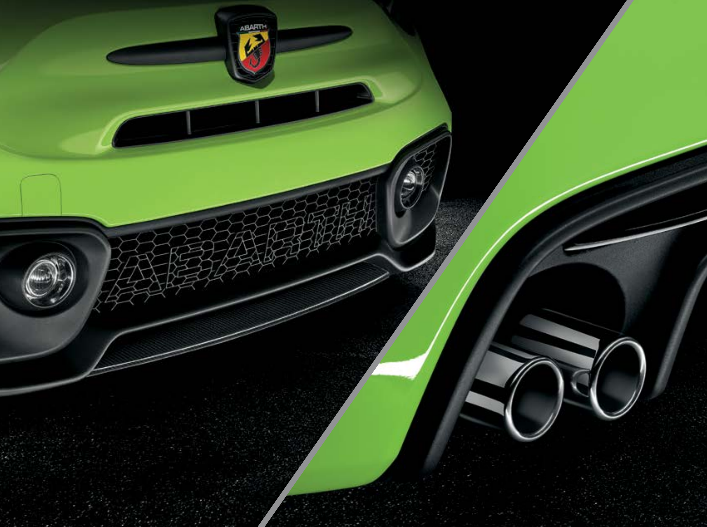
Defletor dianteiro em fibra de carbono