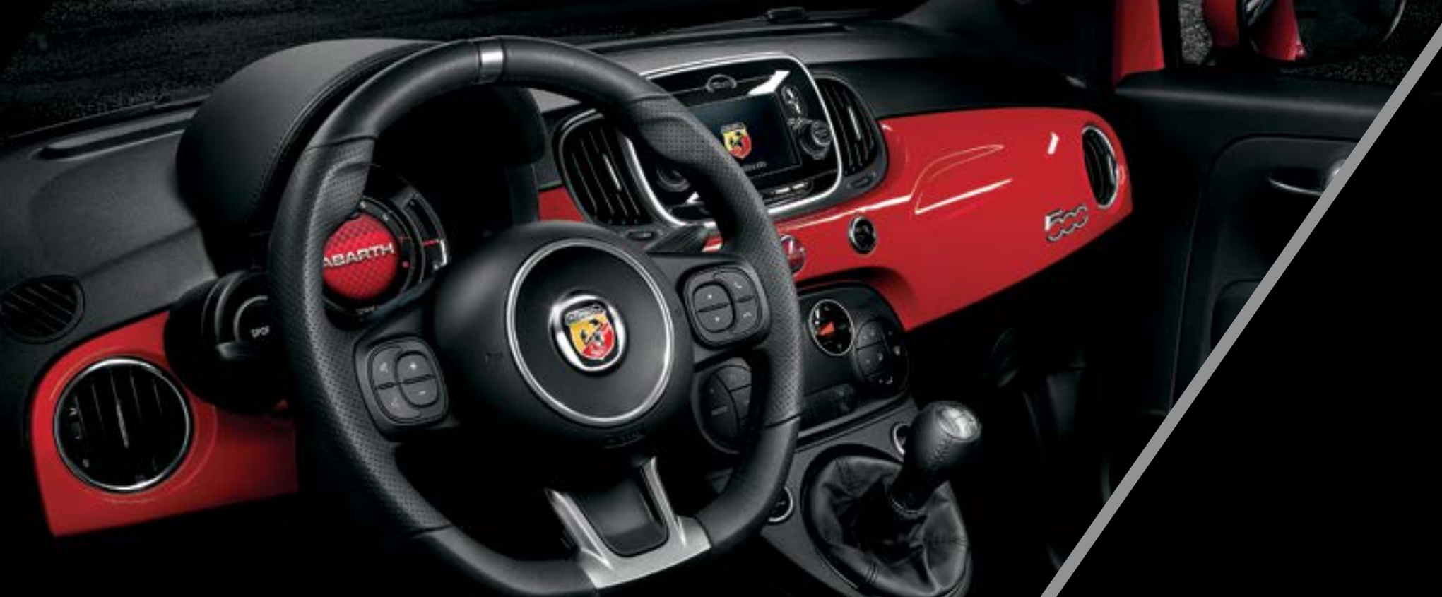
Tabliê da cor da carroçaria