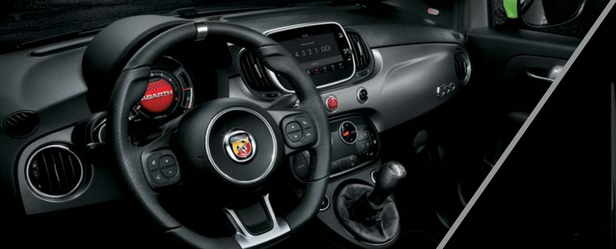
Tabliê em cinzento opaco