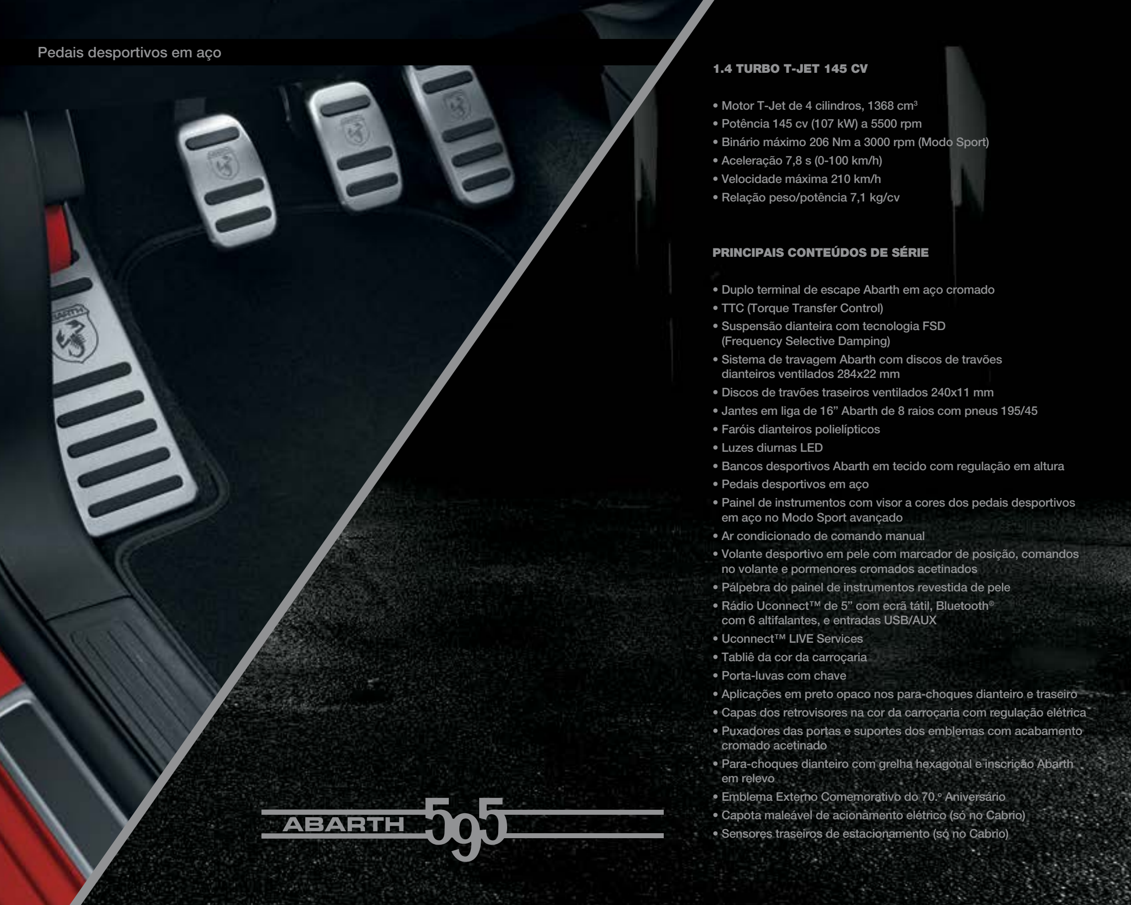
Pedais desportivos em aço