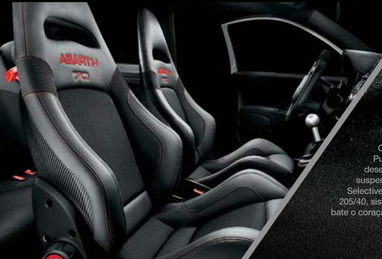
Sabelt® 70 Racing em Carbono

O símbolo da performance do Escorpião: Abarth 595 Esseesse. Pura potência, pura performance. Um automóvel feito para quem só deseja o melhor. Equipado com motor de 180 cv T-Jet de 4 cilindros, suspensão dianteira e traseira Koni com tecnologia FSD (Frequency Selective Damping), jantes em liga de 17" Supersport brancas com pneus 205/40, sistema de escape Akrapovič e o exclusivo Rádio NAV 7". É aqui que bate o coração das emoções.