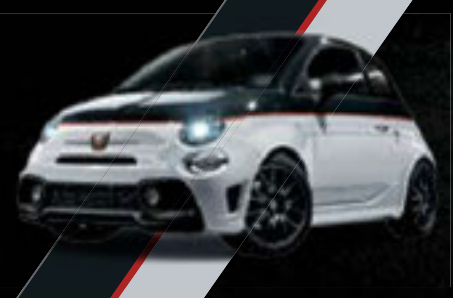
Preto Scorpione/ Branco Gara