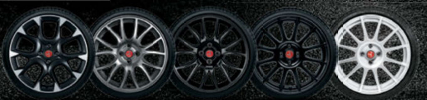
17" CORSA 17" FORMULA 17" FORMULA 17" SUPERSPORT 17" SUPERSPORT BRANCO RACE