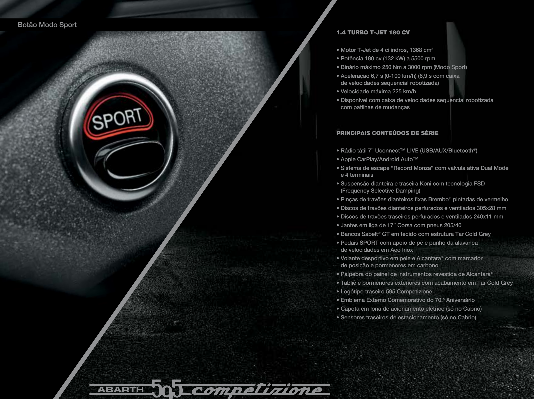
Botão Modo Sport