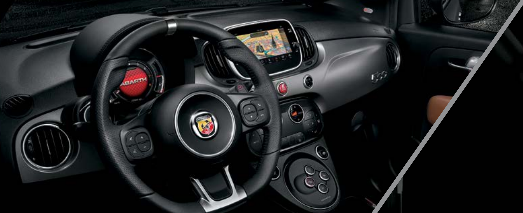
Tabliê com acabamento cinzento opaco