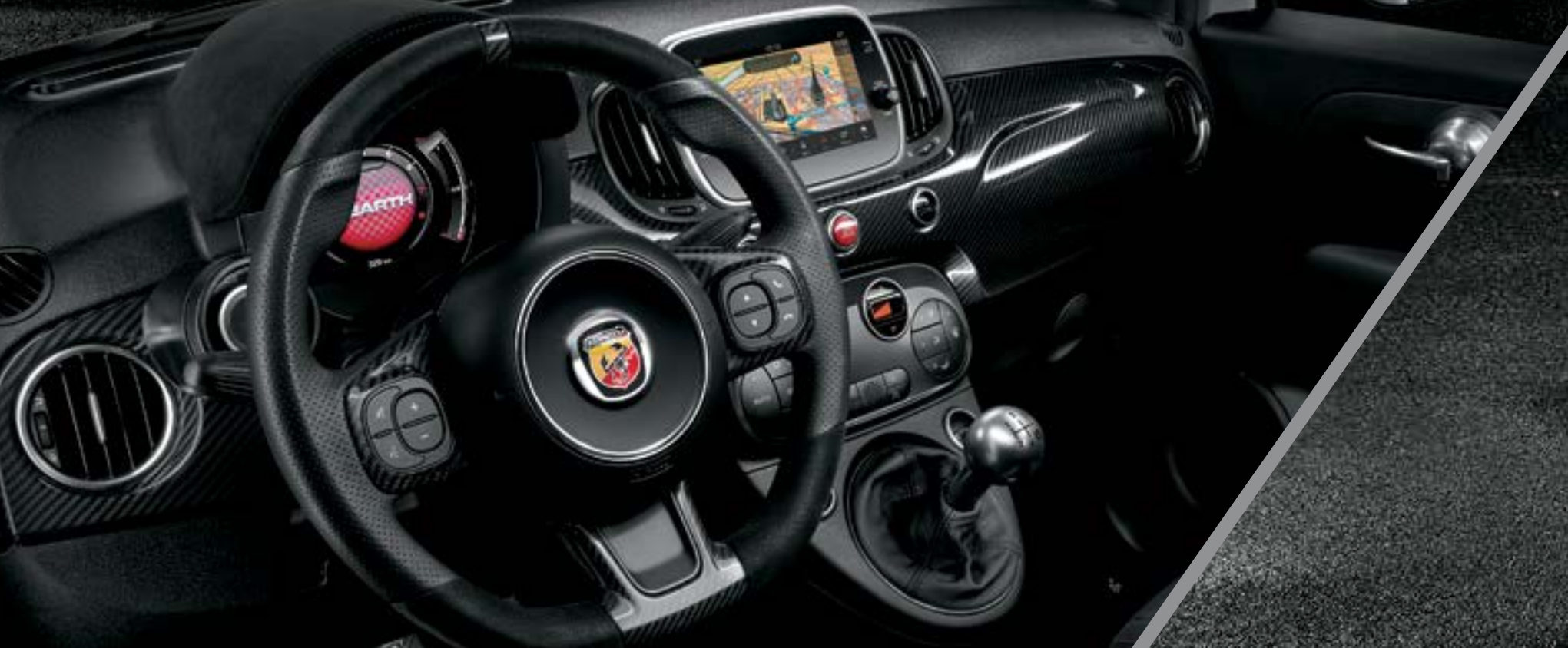
Detalhes exteriores com acabamento em Tar Cold Grey, Rádio NAV 7" e tabliê em carbono (Opc.)