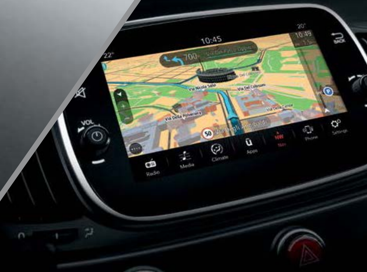
Rádio NAV LIVE 7" com Apple CarPlay/Android Auto™