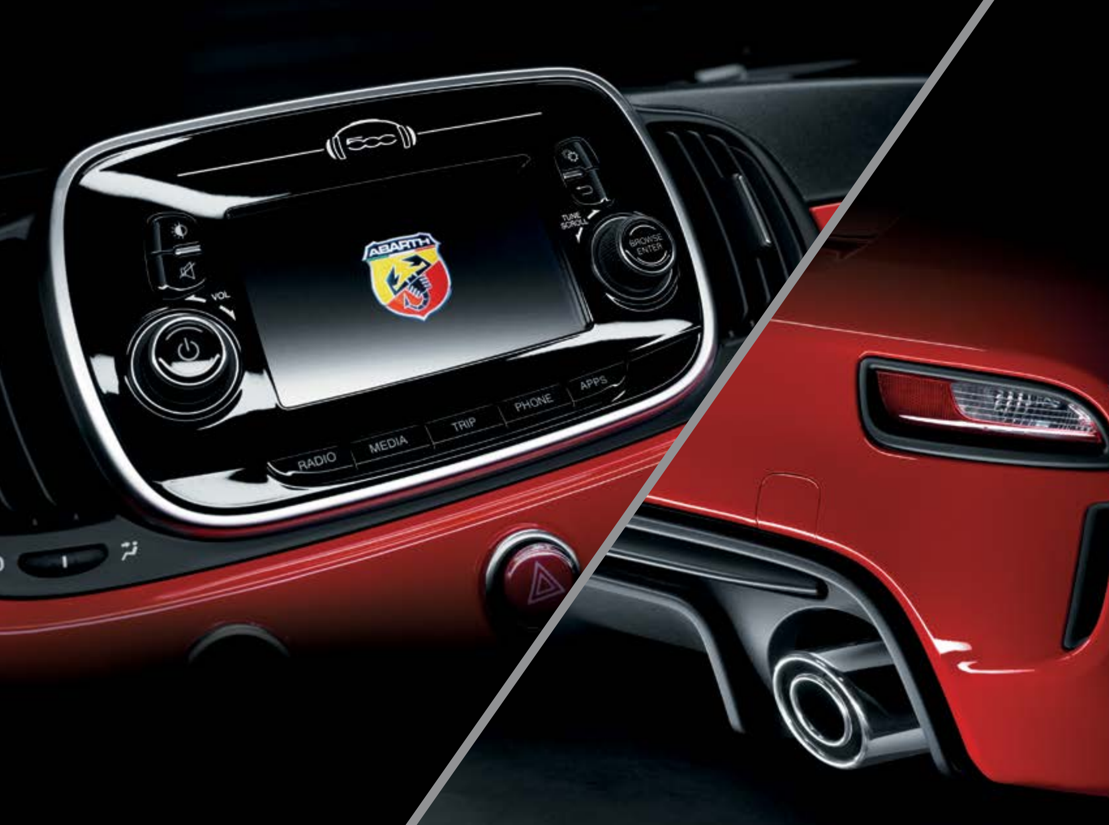
Rádio Uconnect™ Live 5" com comandos no volante