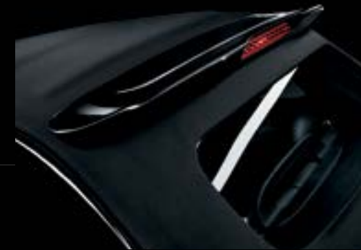
Capota em lona preta