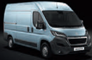
Azul Lago Azzuro