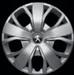
Tampão de 16" (apenas nas versões 435)