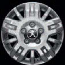
Jantes liga leve 15"