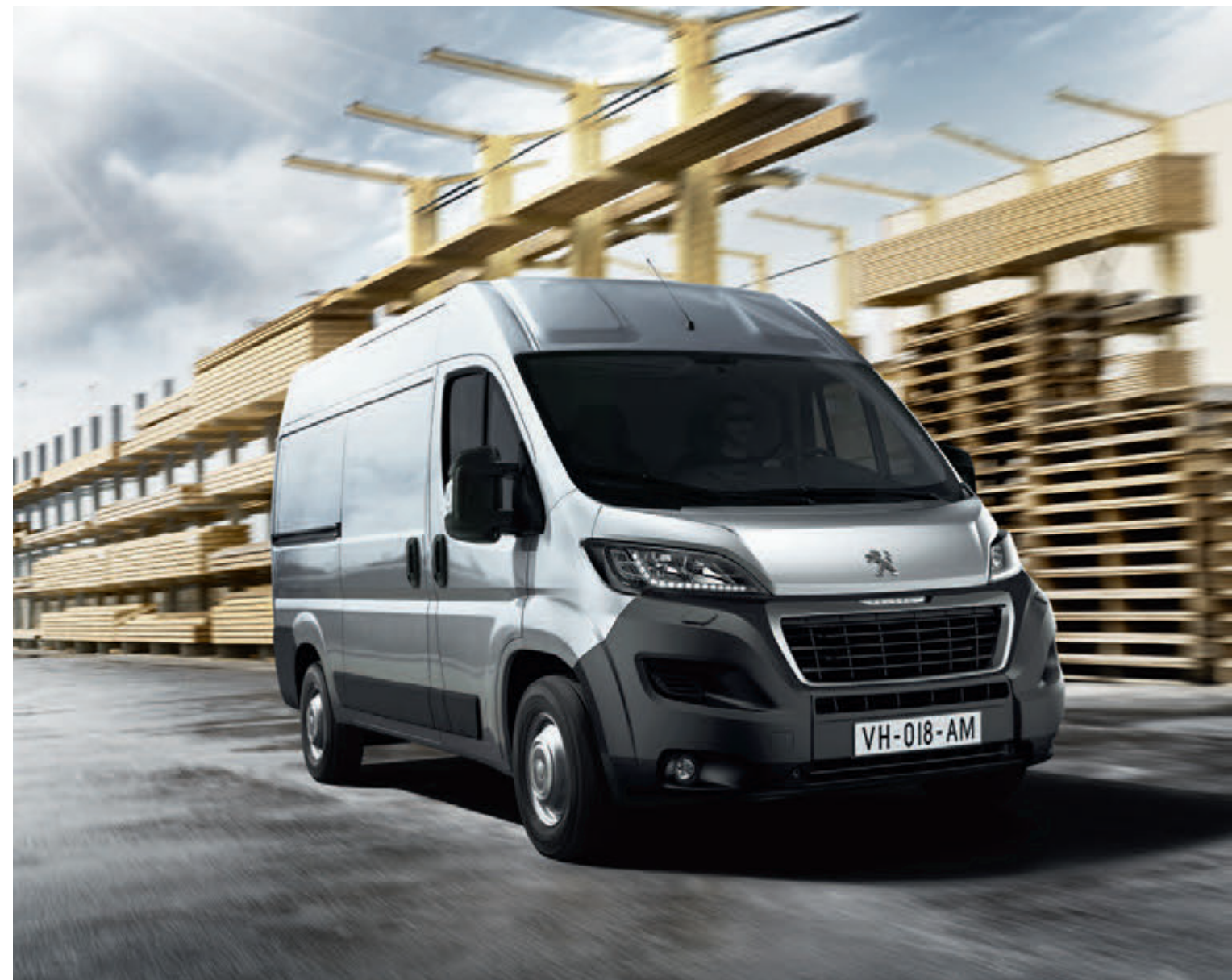
NOVO PEUGEOT BOXER