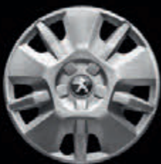
Tampão de 15"