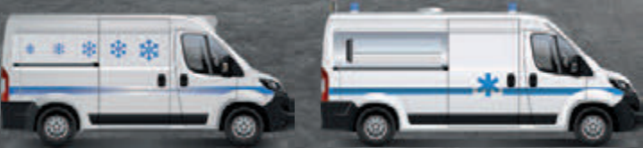
Célula isotérmica integrada no furgão

(Exemplos de transformações. Visual não contratual.)