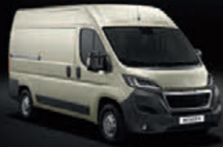
Bege Golden White