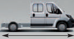
Chassis cabine dupla