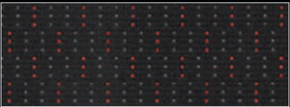
• Tecido Darko (preto/ vermelho)