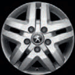
Jantes liga leve 16" (apenas nas versões 435)