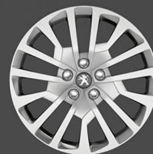
Tampões Miami 17"