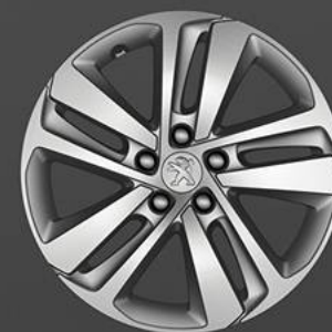
Jantes em liga leve Phoenix 17"