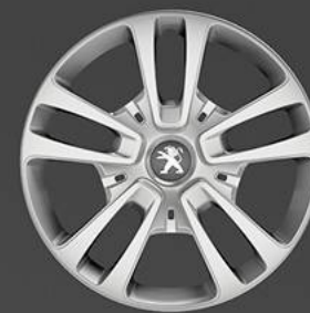
Tampões San Francisco 16"