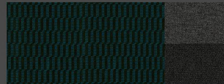
Tecido e malha Cran Bleu (Active)