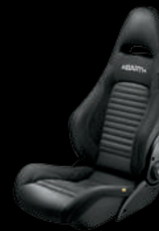
Pele preta Sabelt® GT (opcional no 595 Competizione)