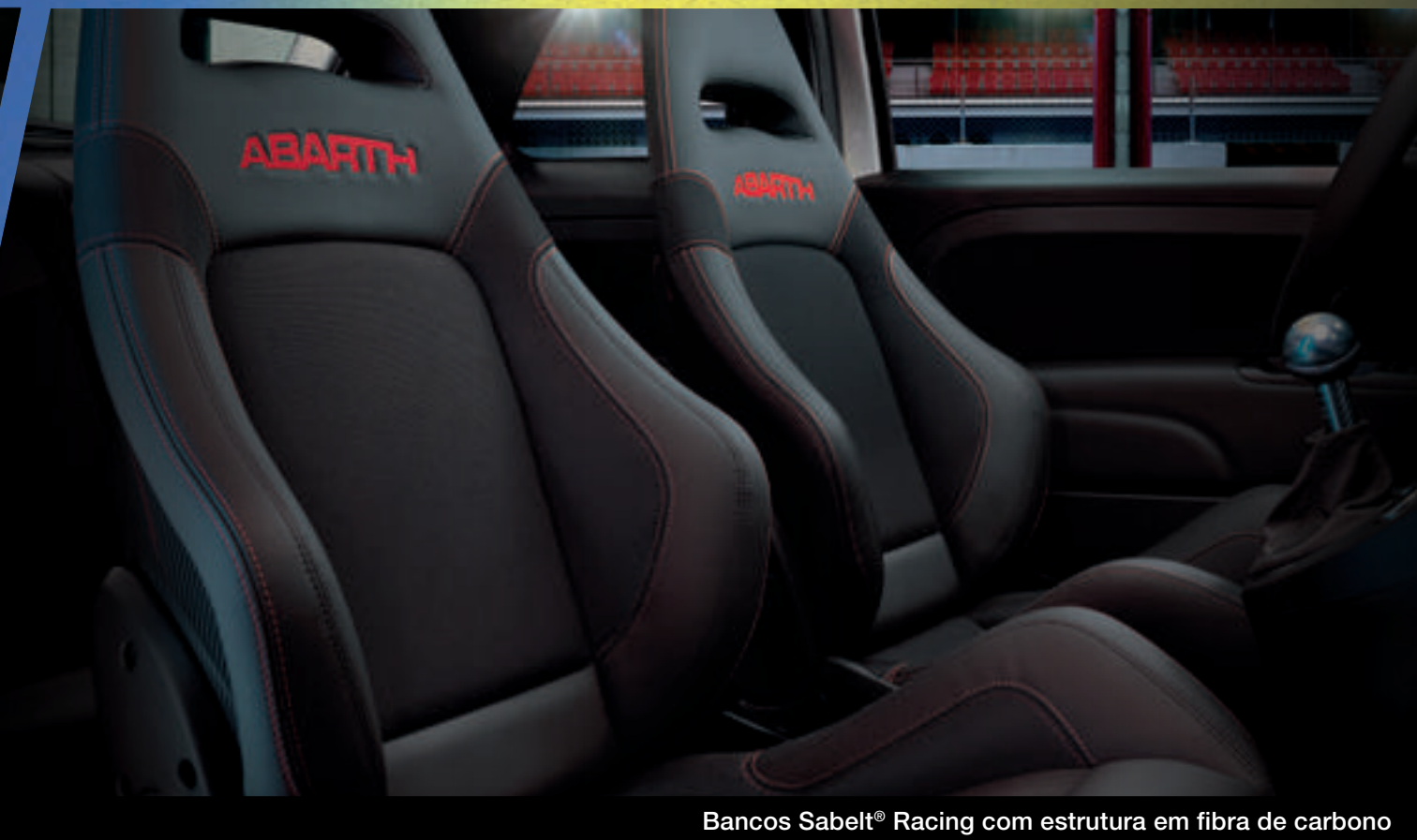
Bancos Sabelt® Racing com estrutura em fibra de carbono