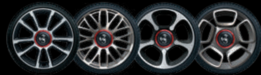
17" GRANTURISMO 17" TOURING 17" TROFEO 17" SPORT