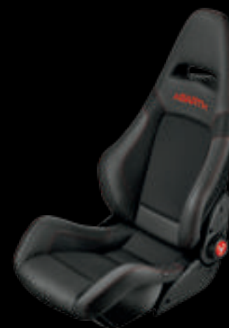
Fibra de carbono Sabelt® Racing com estrutura em fibra de carbono (de série no 595 esse)