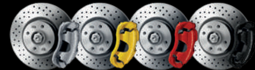
Cinzentas (de série no 595 Turismo) Amarelas Vermelhas Pretas