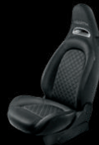
Tecido preto (de série no 595)