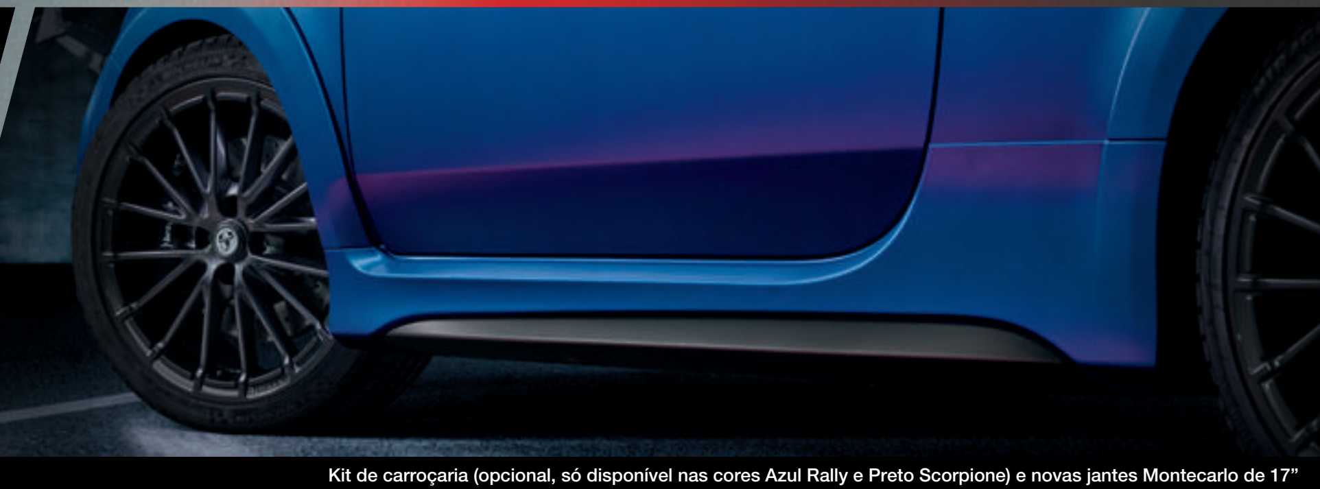
Kit de carroçaria (opcional, só disponível nas cores Azul Rally e Preto Scorpione) e novas jantes Montecarlo de 17"