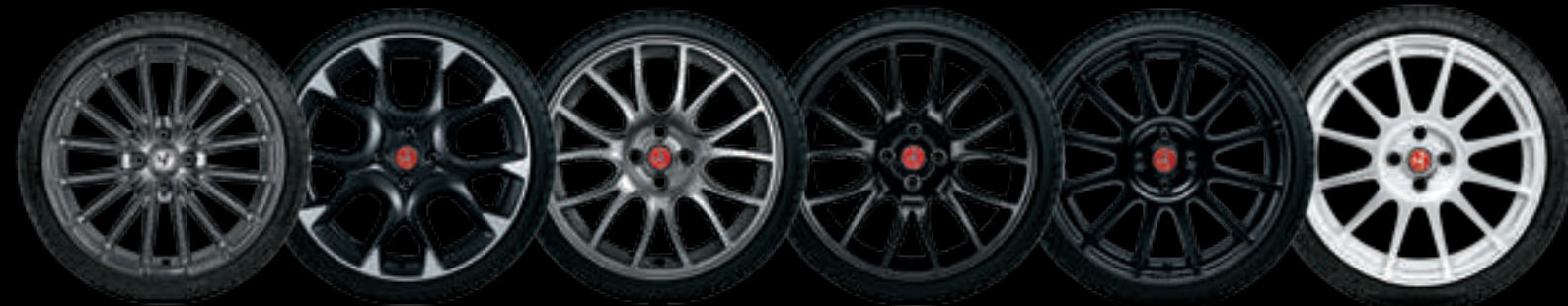
17" MONTECARLO 17" CORSA 17" FORMULA 17" FORMULA ESCURECIDAS 17" SUPERSPORT PRETO OPACO 17" SUPERSPORT BRANCO RACING