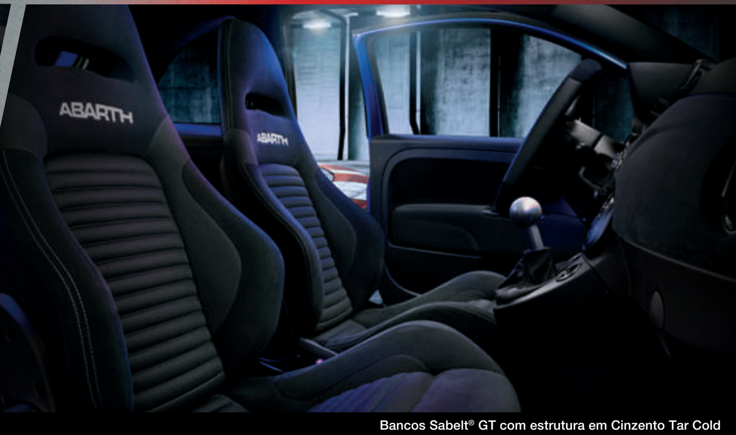
Bancos Sabelt® GT com estrutura em Cinzento Tar Cold