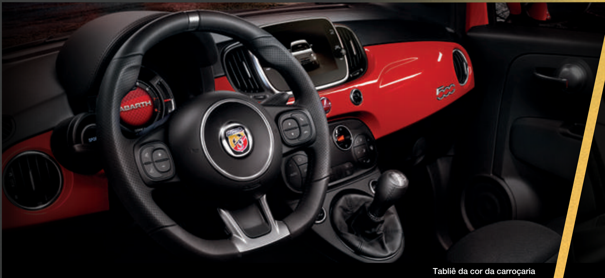
Tabliê da cor da carroçaria