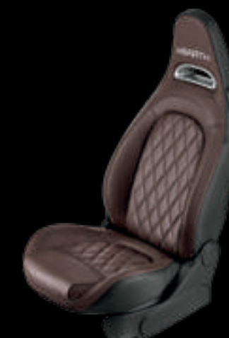
Pele em castanho Helmet (opcional no 595, 595 Turismo e 595 Competizione)