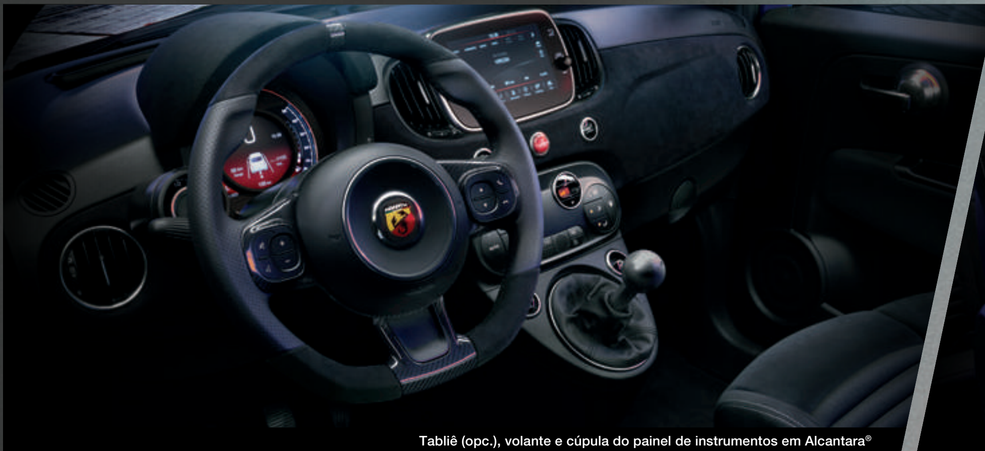
Tabliê (opc.), volante e cúpula do painel de instrumentos em Alcantara®