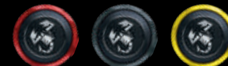
Vermelhas Cinzentas Amarelas