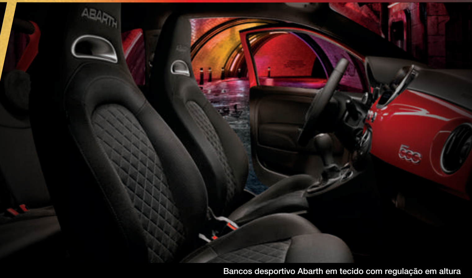
Bancos desportivo Abarth em tecido com regulação em altura