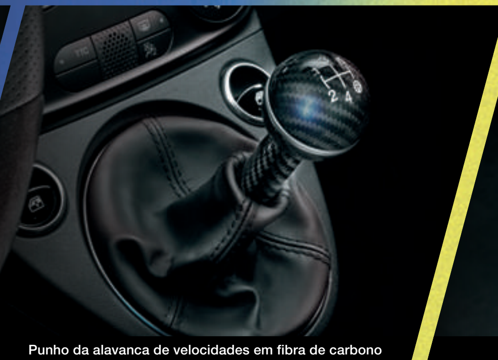
Punho da alavanca de velocidades em fibra de carbono