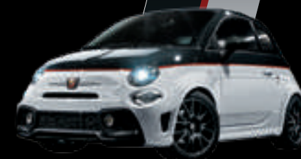
Preto Scorpione / Branco Gara