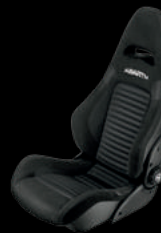
Tecido Sabelt® GT (de série no 595 Competizione)

Concebido para assegurar sustentação lateral digna do mundo da competição. Ideal para se tornar uno com o carro e tirar o máximo partido da condução desportiva.