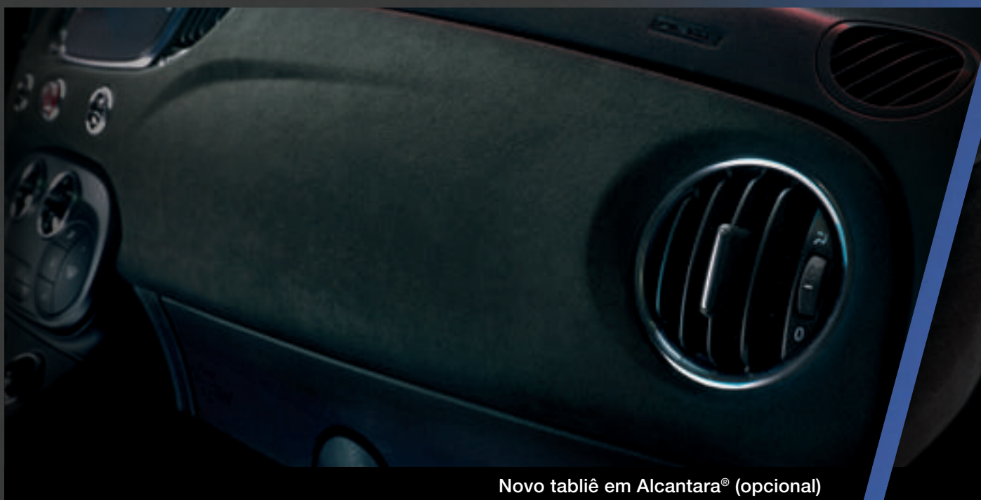
Novo tabliê em Alcantara® (opcional)