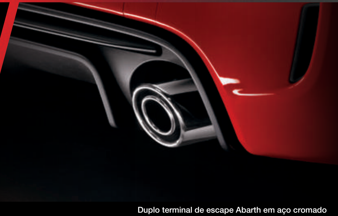
Duplo terminal de escape Abarth em aço cromado