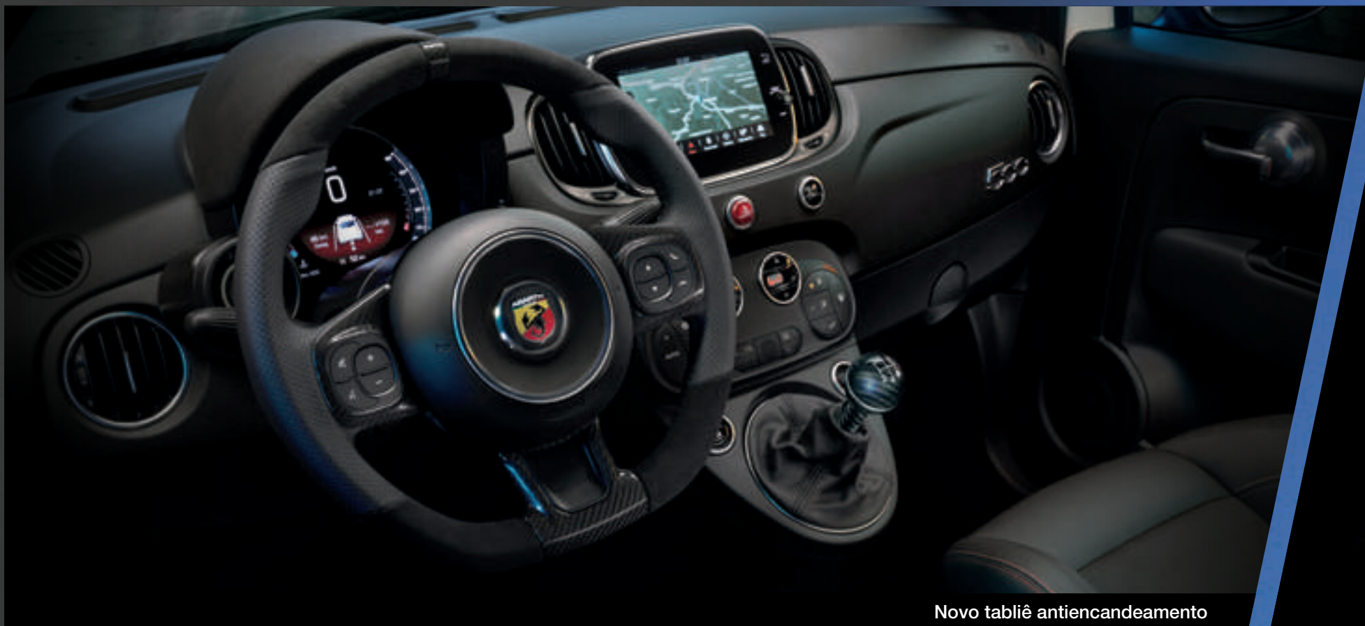
Novo tabliê antiencandeamento