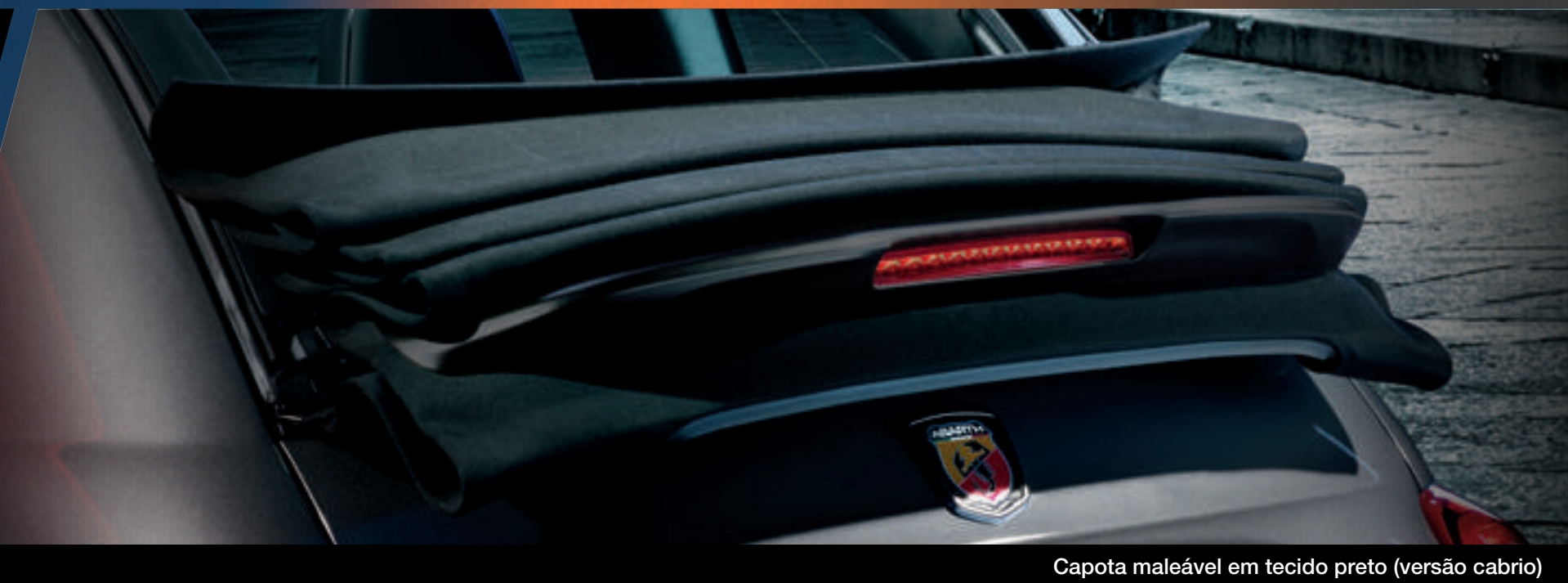
Capota maleável em tecido preto (versão cabrio)