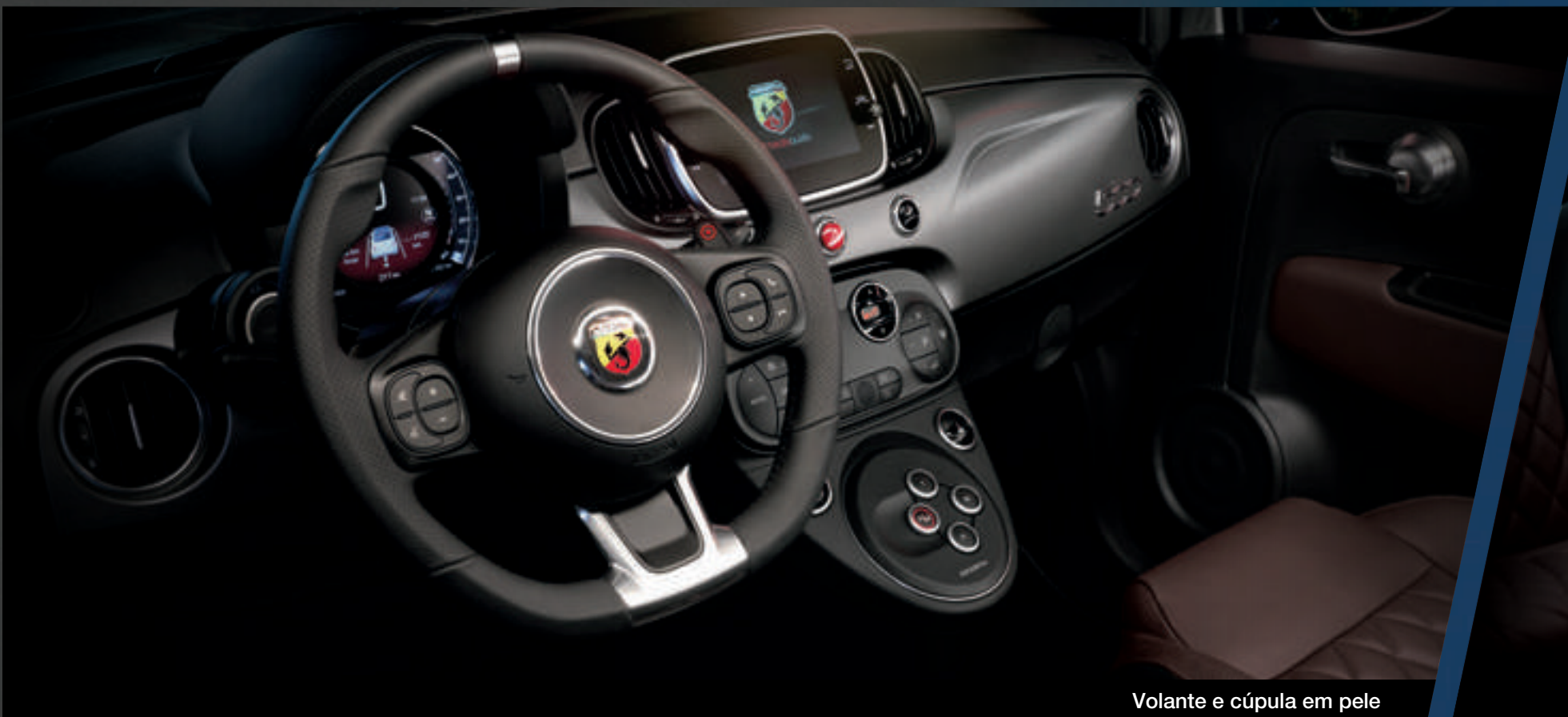
Volante e cúpula em pele