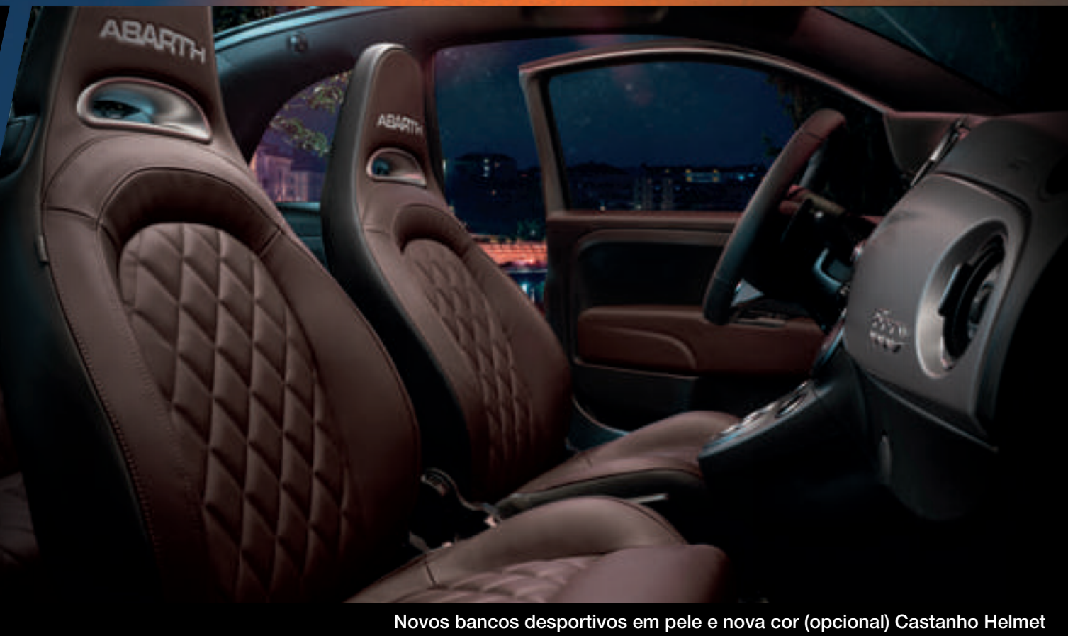
Novos bancos desportivos em pele e nova cor (opcional) Castanho Helmet