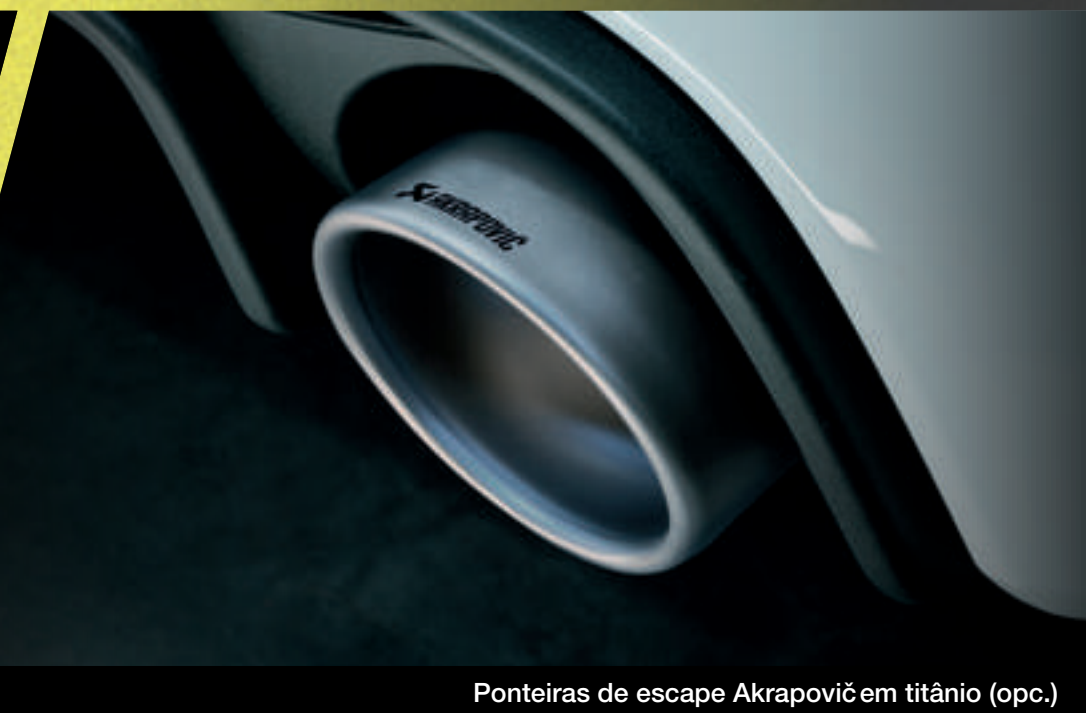
Ponteiras de escape Akrapovič em titânio (opc.)