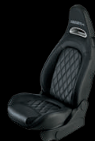
Pele preta (opcional no 595, de série no 595 Turismo)