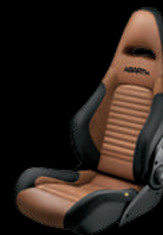
Pele camel Sabelt® GT (opcional no 595 Competizione)