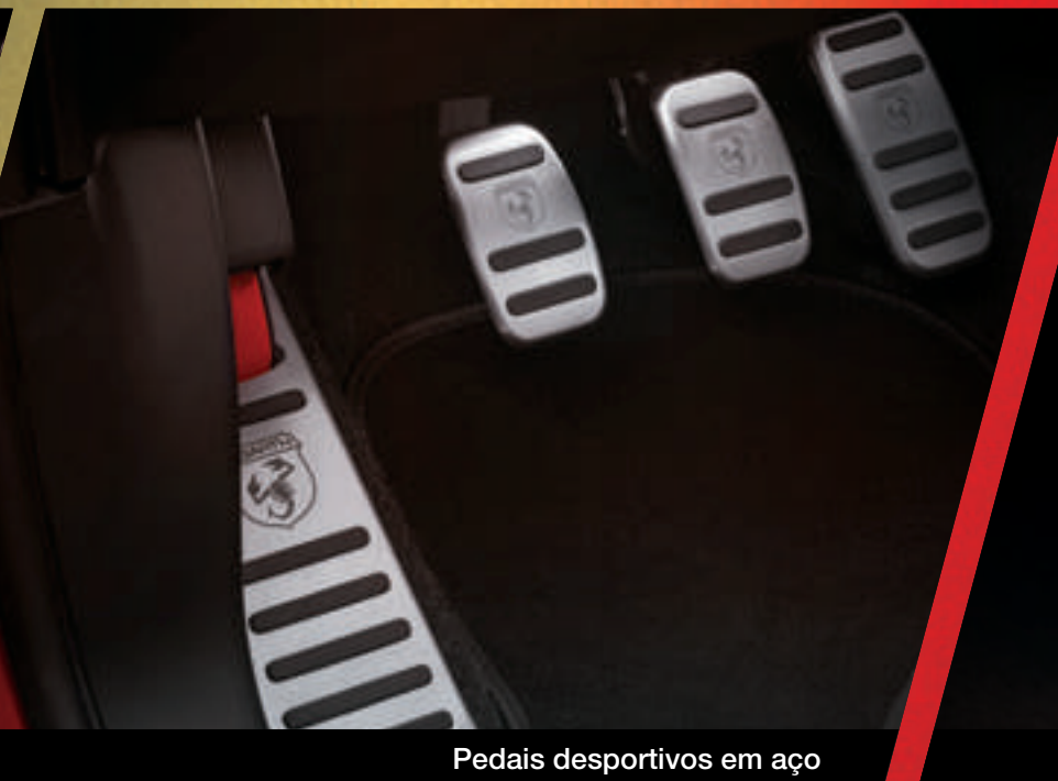
Pedais desportivos em aço