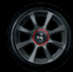
16" 8 RAIOS