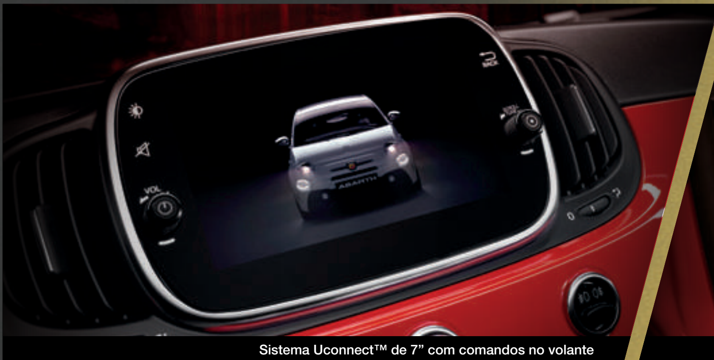
Sistema Uconnect™ de 7" com comandos no volante