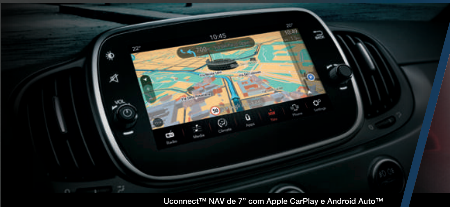
Uconnect™ NAV de 7" com Apple CarPlay e Android Auto™