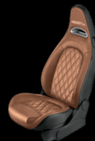
Pele camel (opcional no 595, 595 Turismo e 595 Competizione)