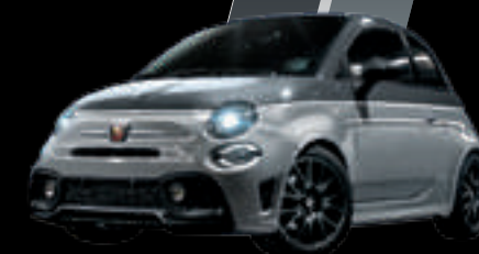
Cinzento Pista / Cinzento Campovolo