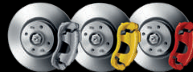
Pinças de travão não pintadas (de série no 595) Amarelas Vermelhas