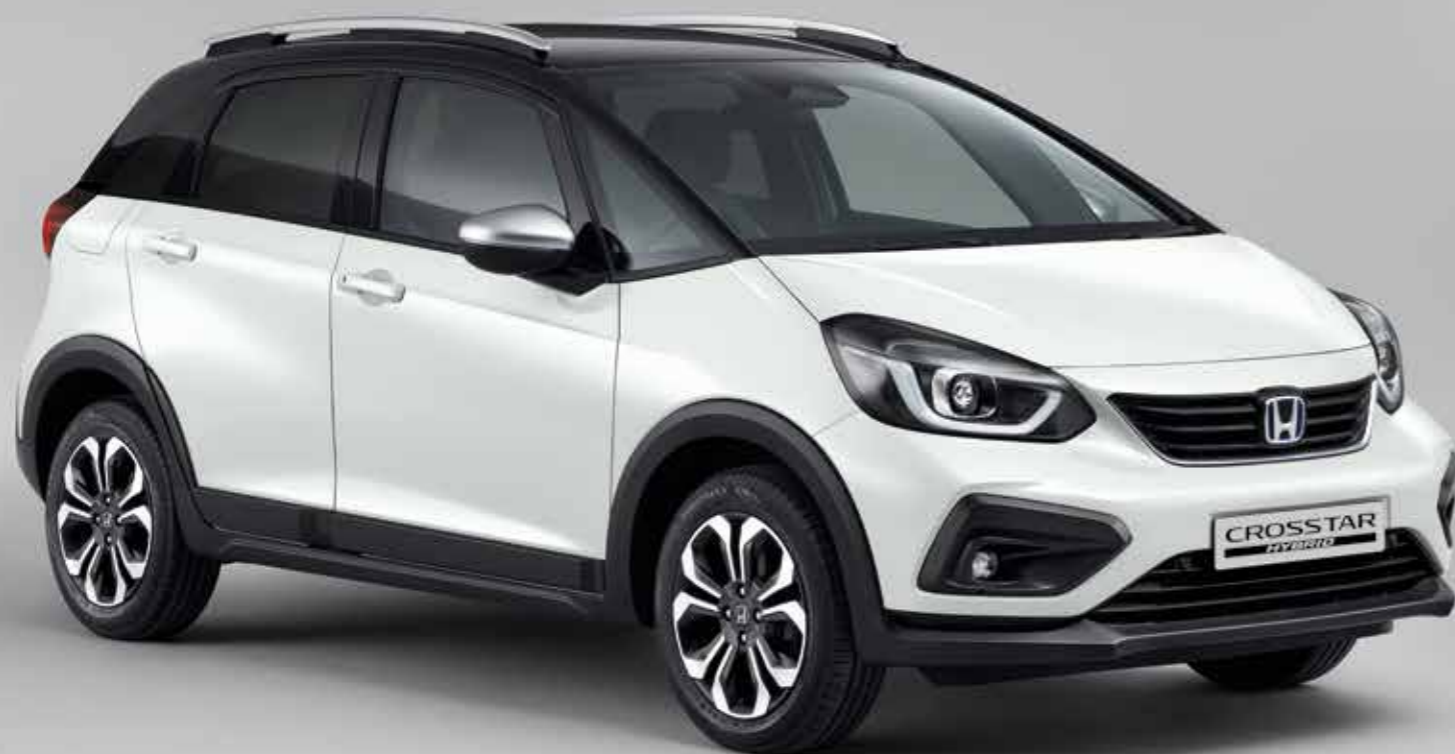
PLATINUM WHITE PEARL / DUAS CORES (NH-883PC)

O novo Crosstar vem com pintura a duas cores, que inclui o novo Surf Blue, sendo o tejadilho sempre na cor Crystal Black Pearl. Os estofos são em tecido à prova de água, o que o ajuda a manter um interior limpo e elegante, onde quer que vá.