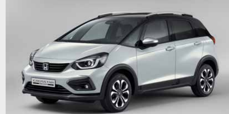
PREMIUM SUNLIGHT WHITE PEARL / DUAS CORES (NH-902PC)