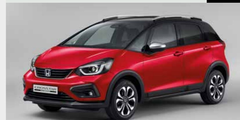
PREMIUM CRYSTAL RED METALLIC / DUAS CORES (R-565MC)