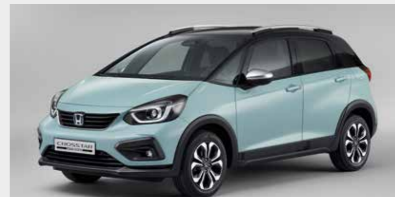
SURF BLUE / DUAS CORES (B-609C)